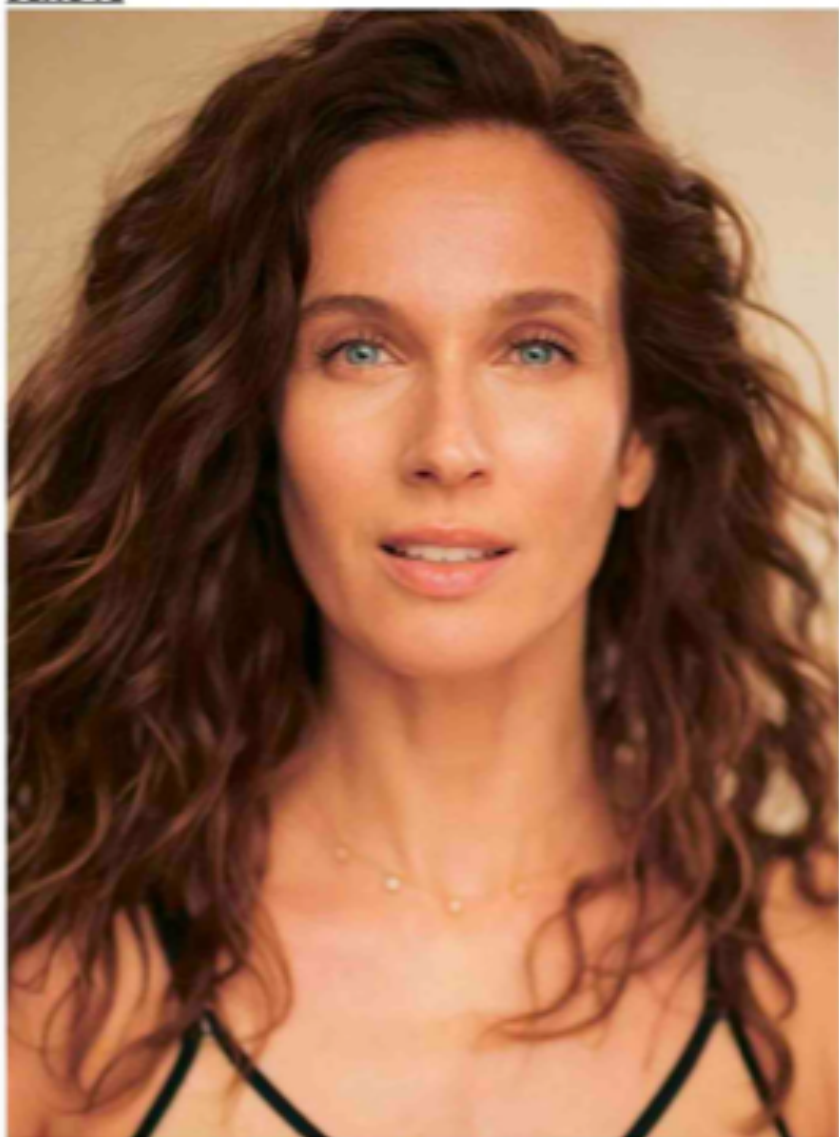
Soins après-épilation Coller Mikera, Institut d'Esthétique Yanni Sargaki.